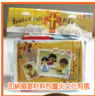
加納婚宴材料包靈火文化有售