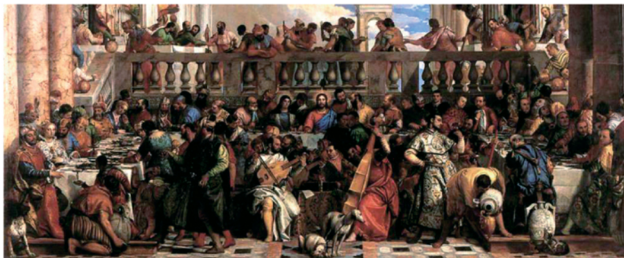
● 這是16世紀意大利畫家Paolo Veronese所畫的加納婚宴，當中有130個人物，場面非常熱鬧呢！