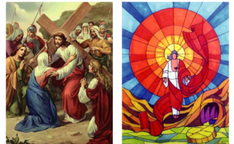
不同畫家所畫的苦路默想圖畫，都很美吧？

參考資料：《逾越之旅》、香港天主教四旬期運動、 http://www.cheuk.com.hk/Path/Path.html