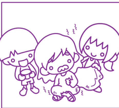
我赤身露體，你們給了我穿的。